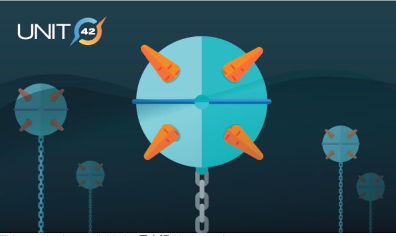
This post is also available in: 日本語 (Japanese)

Tags: CARROTBALL, CARROTBAT, Fractured Statue, KONNI, Phishing, Syscon